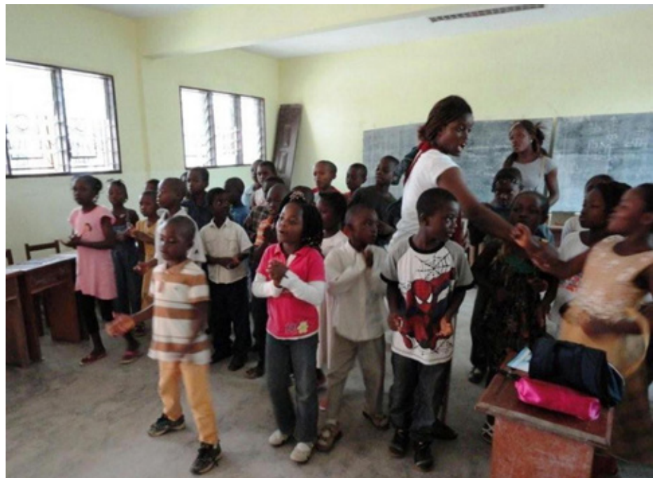
> Centro Socioeducativo. Bafia. Camerún

Este resumen de las cuentas anuales, junto con toda la información más detallada publicada en nuestro sitio web, es un ejercicio agradecido de transparencia con todas esas personas.